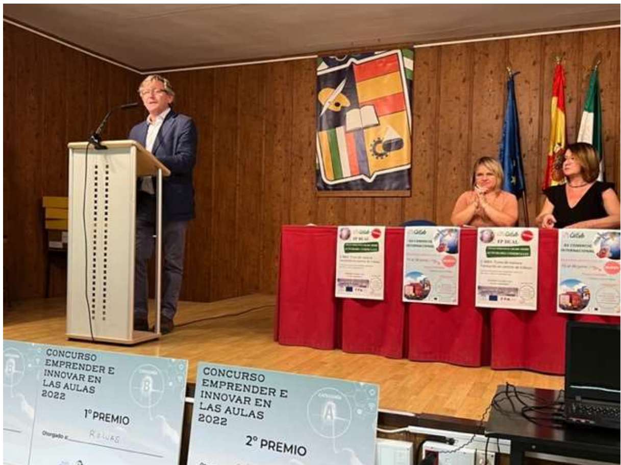
DON ENRIQUE MENDOZA CASAS, CONCEJAL DE TURISMO Y COMERCIO DEL EXCELENTÍSIMO AYUNTAMIENTO DE LINARES