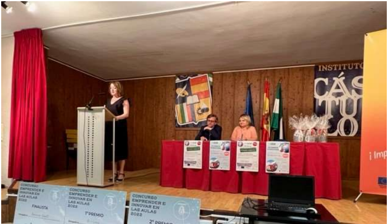
ENTREGA DE PREMIOS CONCURSO “APRENDER E INNOVAR EN LAS AULAS” (15/06/2022)