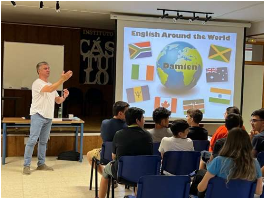
CHARLAS EDITORIAL BURLINGTON. 1º, 3º Y 4º ESO (08/06/2022)