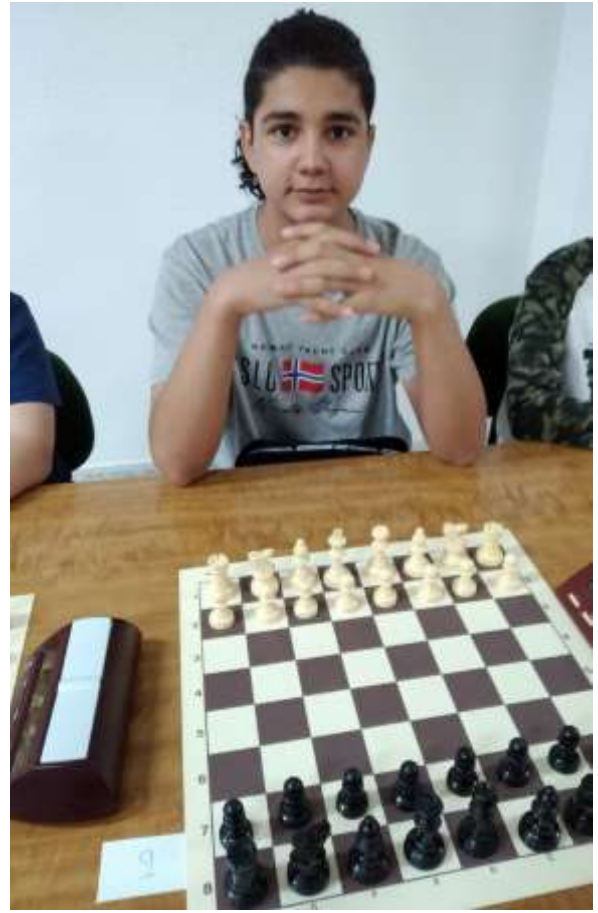
CAMPEONATO ESCOLAR DE AJEDREZ "CIUDAD DE LINARES" (11/06/2022)