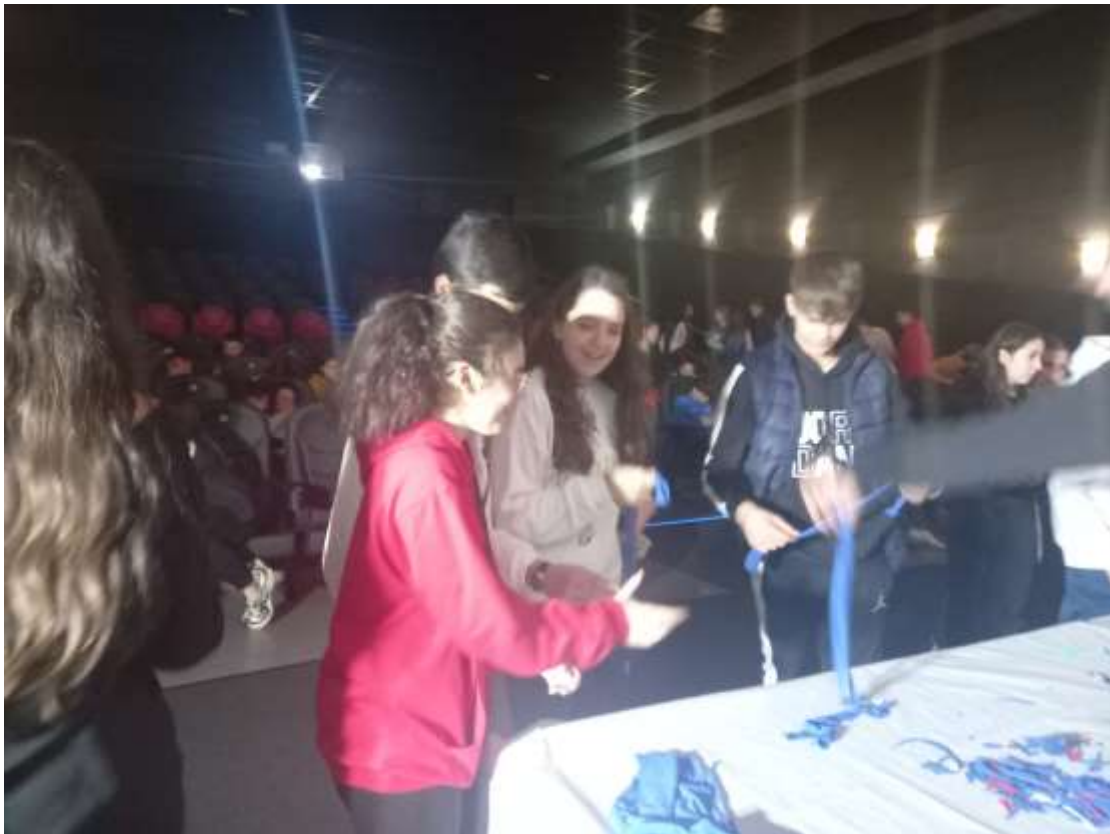
TALLERES "NOVIEMBRE, MES DEL RECICLAJE" 3º Y 4º ESO (18/11/2022)