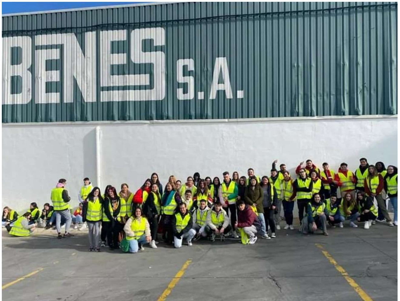
VISITA A EMPRESAS DE PRIEGO DE CÓRDOBA: ÁLMACENES YÉBENES, SUPERMERCADO DARVI Y PATATAS SAN NICASIO. CFGSGV, CFGSCI (01/12/2022)