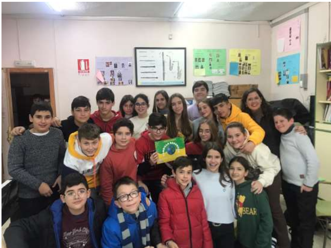
1 ER PREMIO "CONCURSO PANDILLA BASURILLA" . 1º ESO C (30/11/2022)