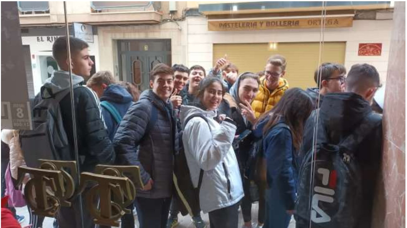
TEATRO CERVANTES "PARA ACABAR CON EDDY BELLEGUEULE". GRUPO LA JOVEN COMPAÑÍA. 4º ESO, 1º Y 2º BTO (22/11/2022)