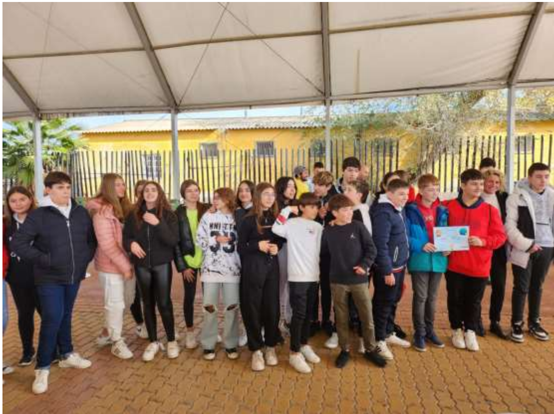
3 ER PREMIO "CONCURSO RECICLA Y PINTA" . 2º ESO B (30/11/2022)