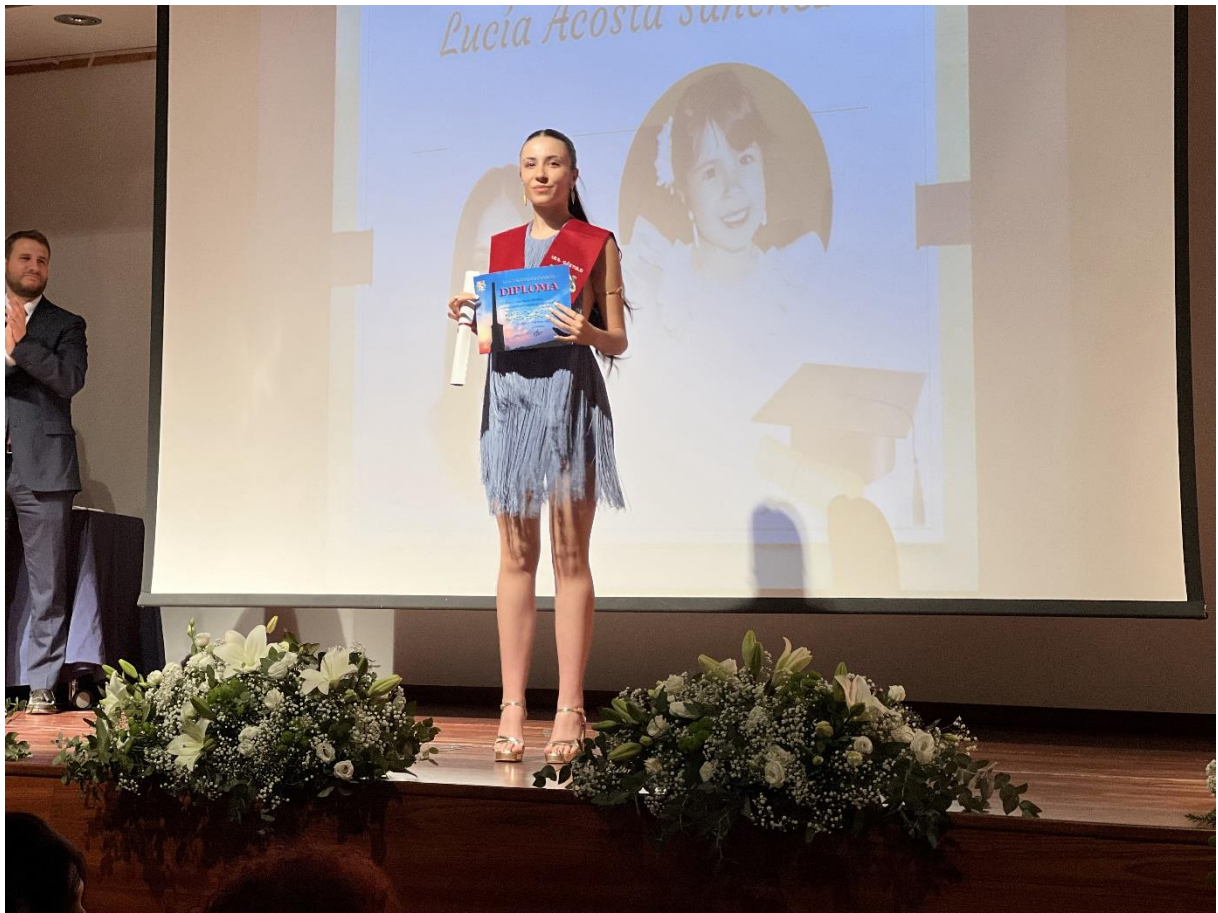
ENTREGA DE BECAS, ORLAS Y DIPLOMAS (CFGs)