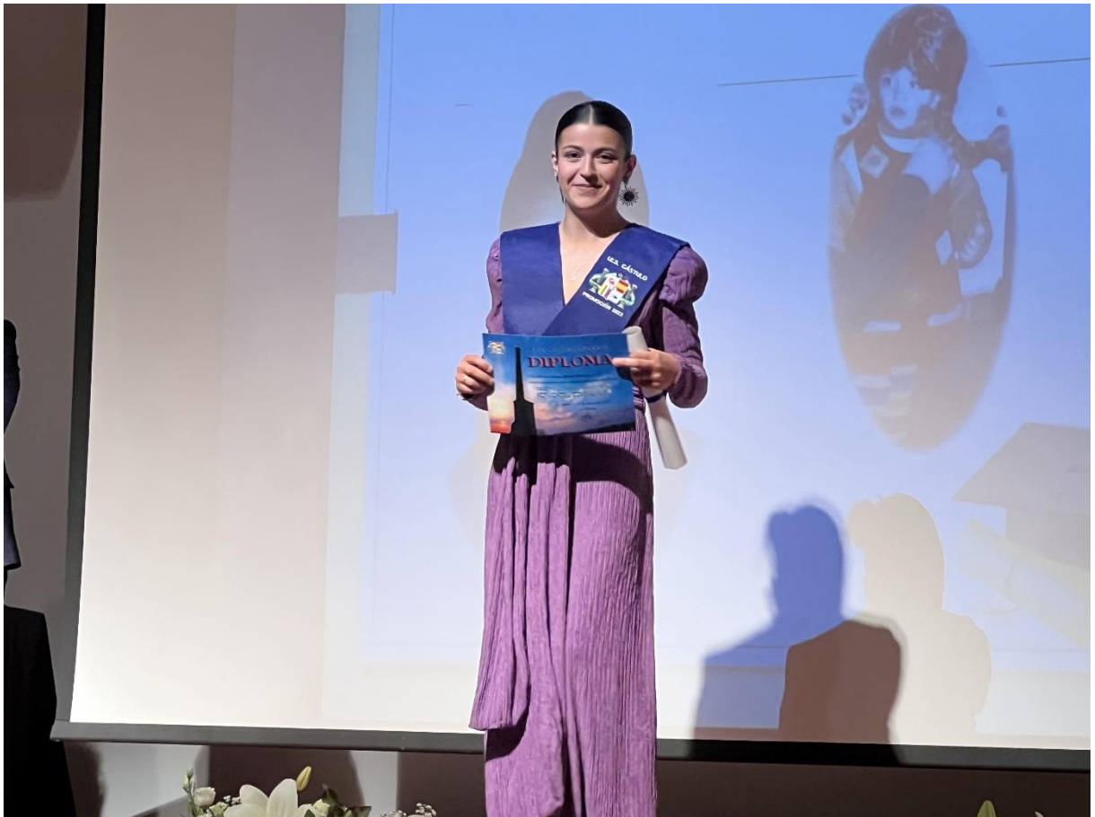
ENTREGA DE BECAS, ORLAS Y DIPLOMAS (CFGM)