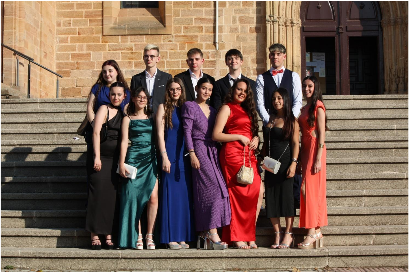
ACTO DE GRADUACIÓN ALUMNADO CFGM Y CFGS (15/06/2023)