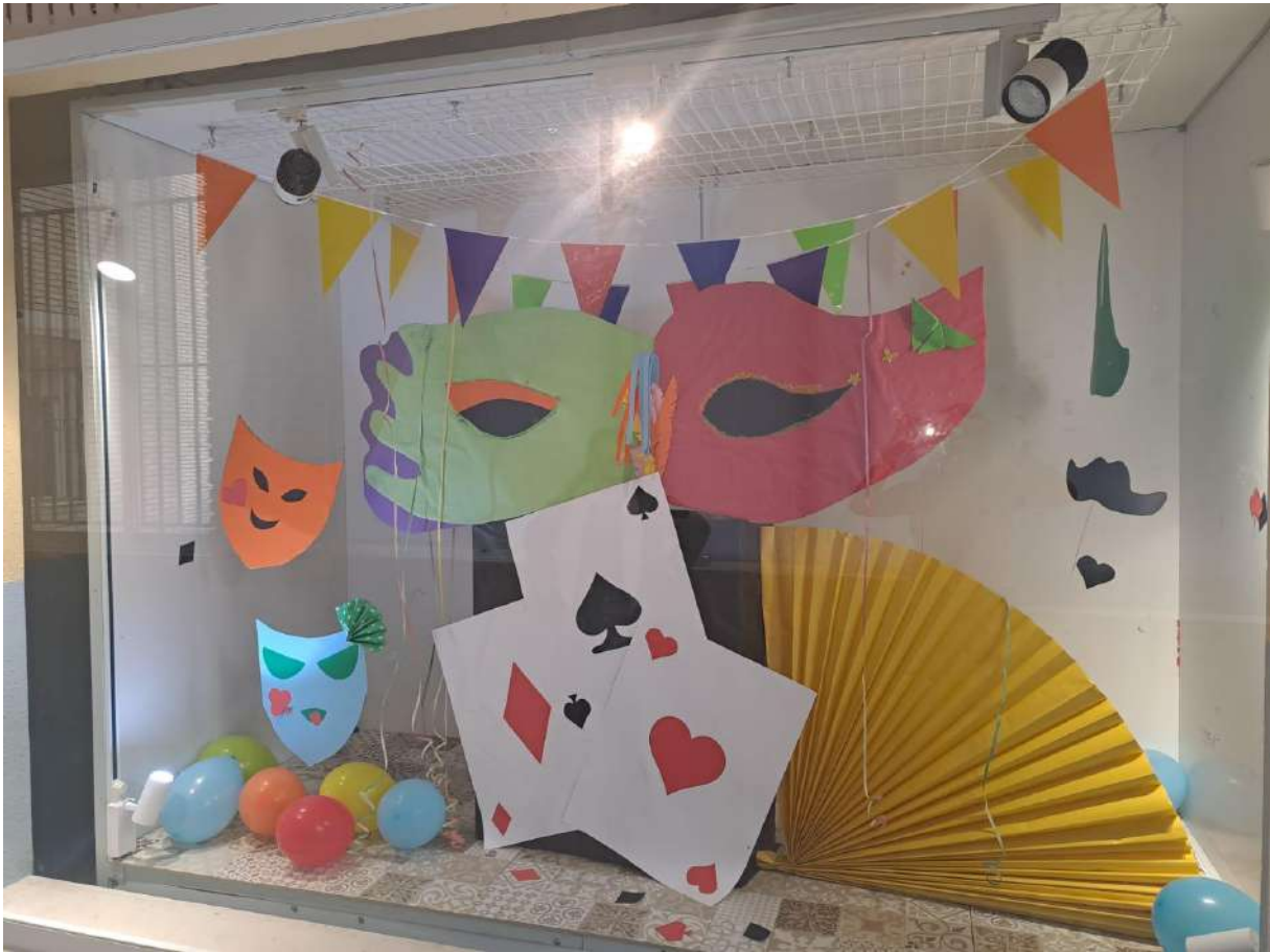
ESCAPARATE CONMEMORATIVO "CARNAVAL 2025"