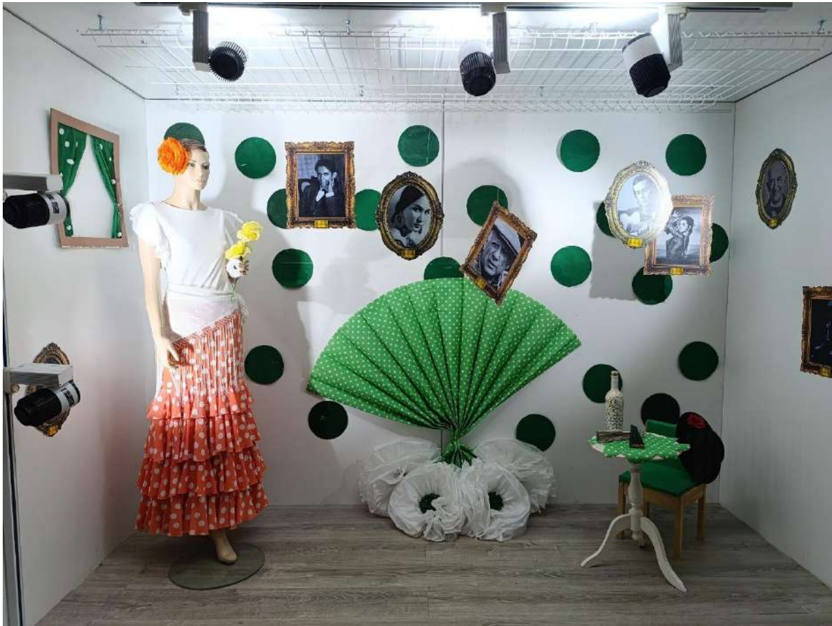
ESCAPARATE CONMEMORATIVO "DÍA DE ANDALUCÍA"