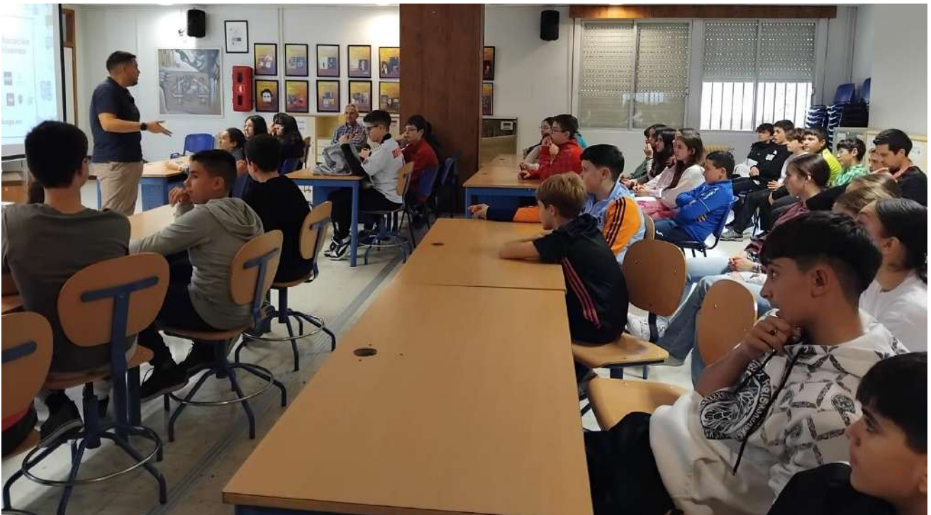
TALLER EDUFINET "CONCEPTOS BÁSICOS SOBRE DINERO Y FINANCIACIÓN"

FUNDACIÓN UNICAJA. 1º Y 2º ESO (07/03/2025)