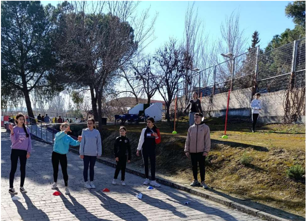
JUEGOS POPULARES Y TRADICIONALES. ESPECIAL DÍA DE ANDALUCÍA. 1º Y 2º ESO (26/02/2025)