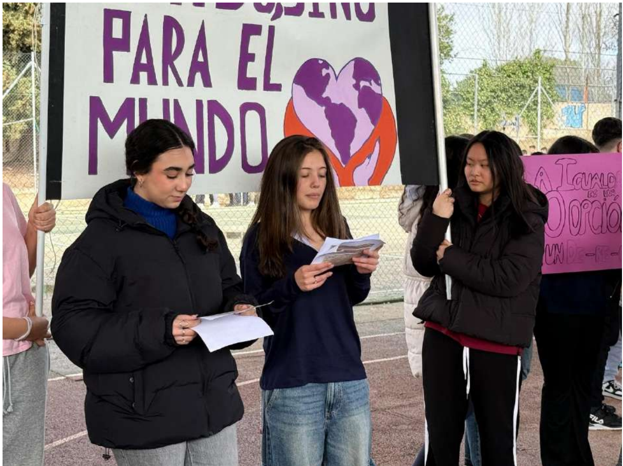
MANIFIESTO 8M, “NO LUCHAMOS CONTRA EL MUNDO, SINO PARA EL MUNDO”