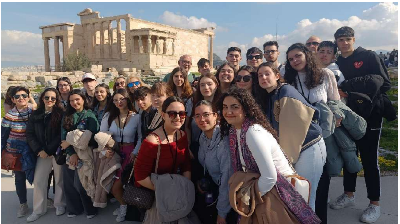
VIAJE A GRECIA. 1º Y 2º BTO LATÍN (27-2/03/2025)